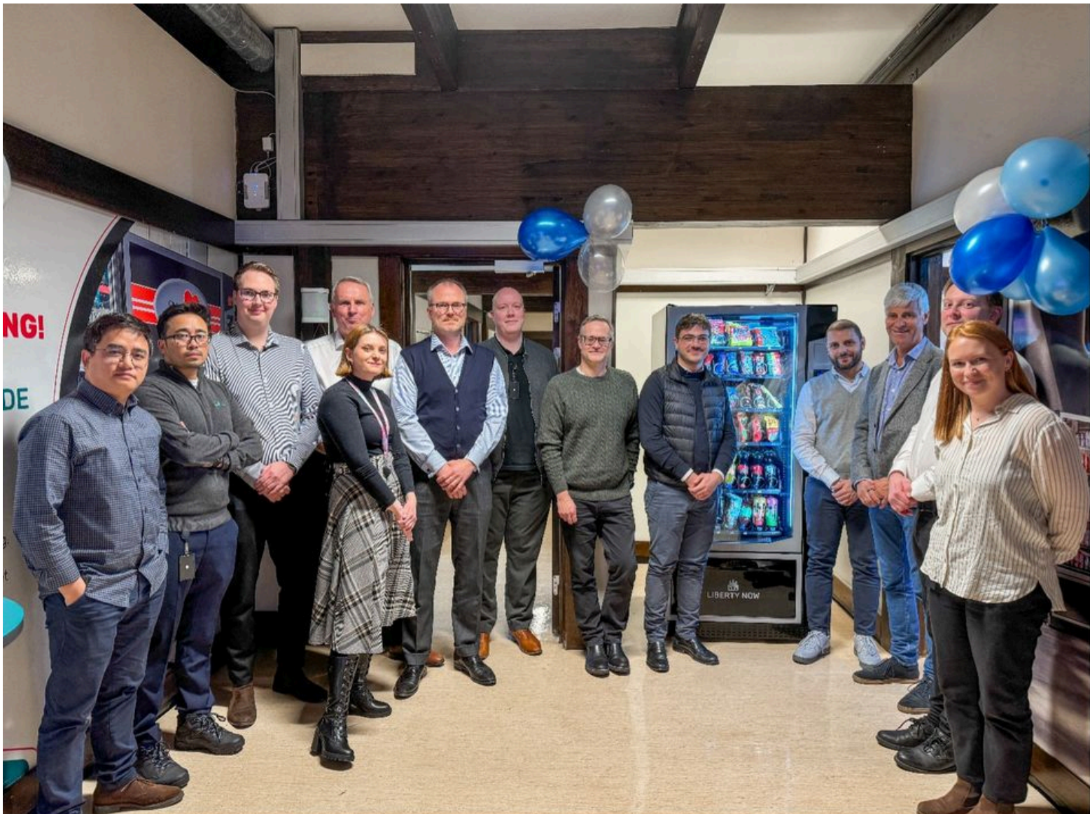
Liberty Now og Epta i forbindelse med nordisk lansering av salgsautomater

Liberty Now og Epta International har fra tidligere også lansert RMA-Cabinet Barcode for det nordiske markedet.