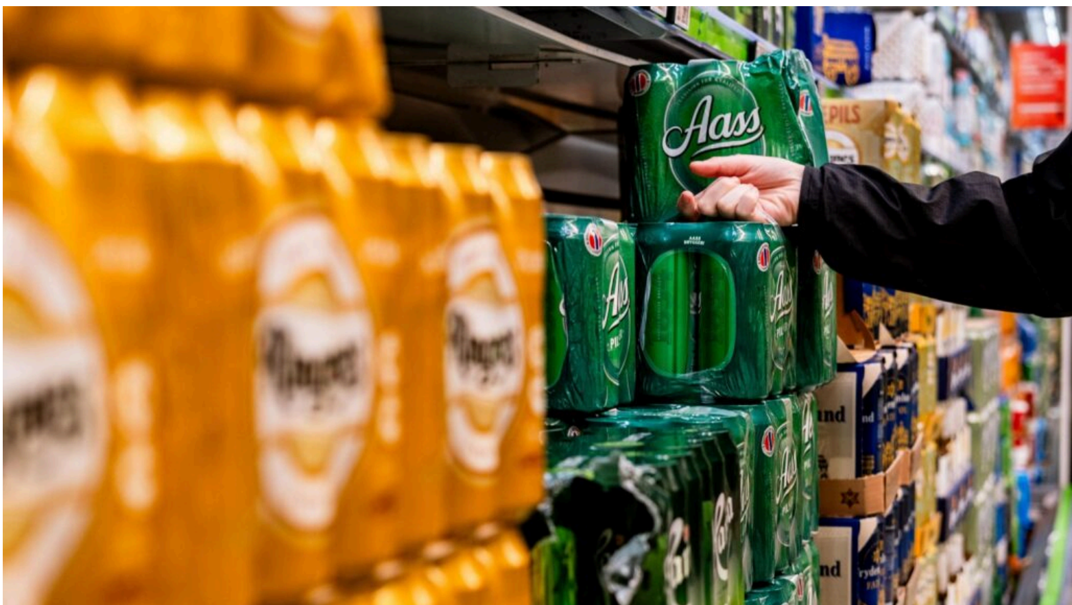
LEGITIMASJON: Folk må vise legitimasjon når man kjøper alkohol selv om en nærbutikk er ubemannet.

Regjeringen skal nå undersøke hvilke endringer som må til for at ubemannet alkoholsalg skal være omfattet av lovverket, kunngjør Vestre.