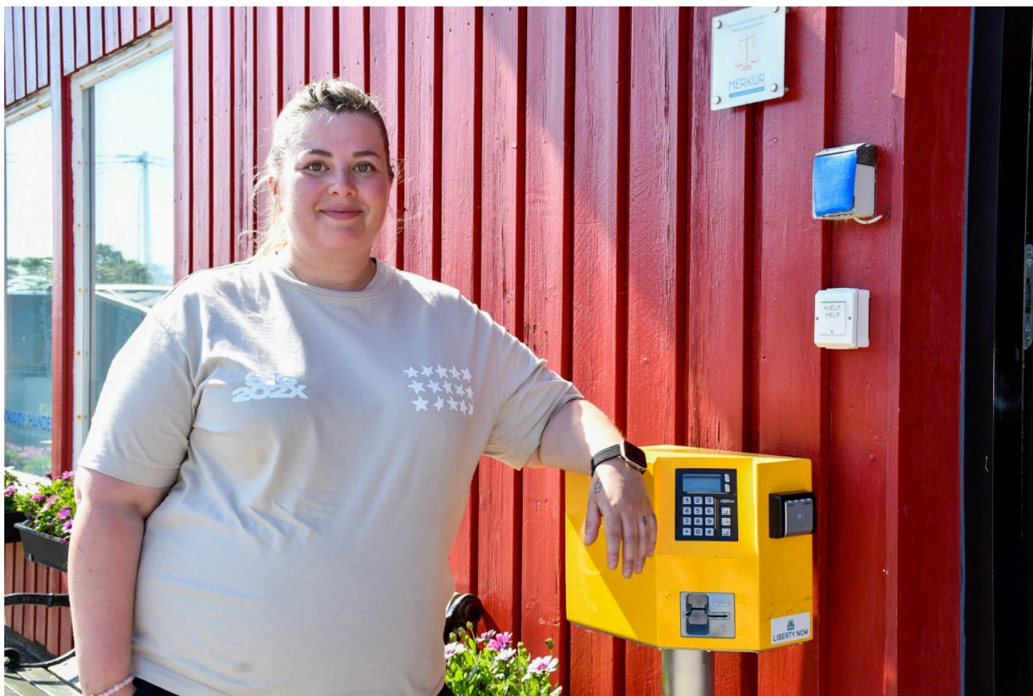
For å komme inn i butikken når døra er låst kan kundene scanne bankkortet sitt, så åpnes døra.

En selvbetjent butikk vil si at det er en gul boks utenfor døra til butikken. Der scanner kundene bankkortet sitt for å få åpnet. Så kan de handle som de vil og betaler i en selvbetjent kasse, slik som mange kjenner til fra andre butikker i landet.