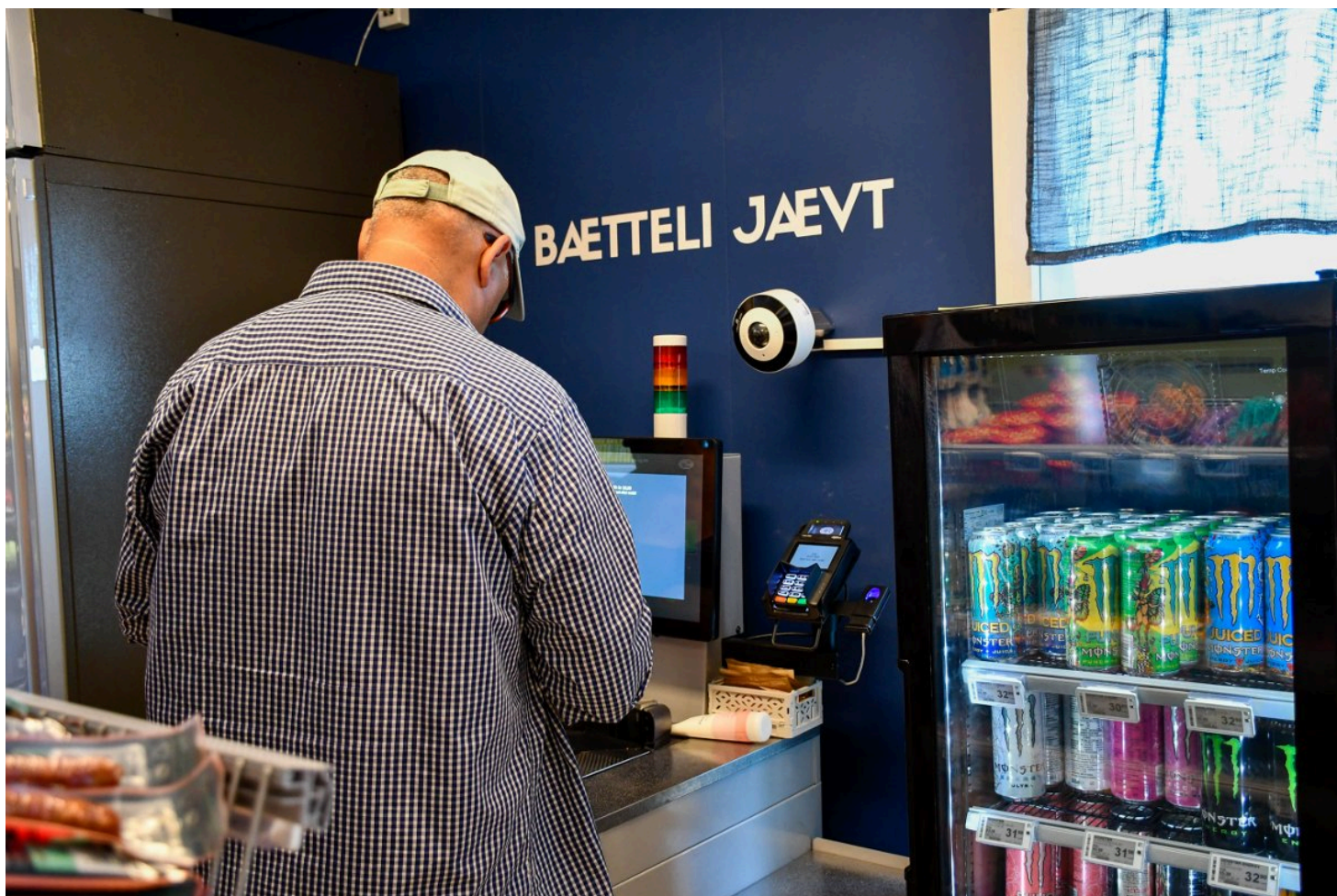
Kundene til Kvarøy Handel forteller at de er svært fornøyd med at lokalbutikken har blitt selvbetjent.

Men det er de hun driver butikken for som gjør at hun elsker jobben sin.