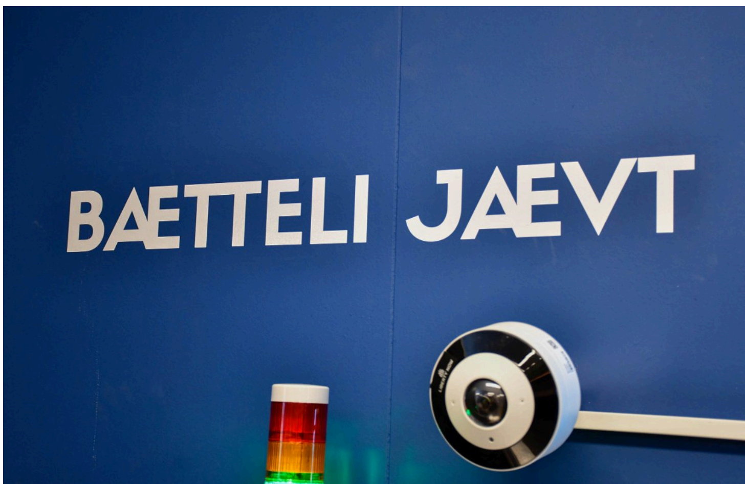
Slagordet til Kvarøy Handel er 'Bætteli Jævt'.

– De har vært til veldig god hjelp og har alltid vært til svars hvis jeg lurere på noe eller har problemer med systemer, sier hun.