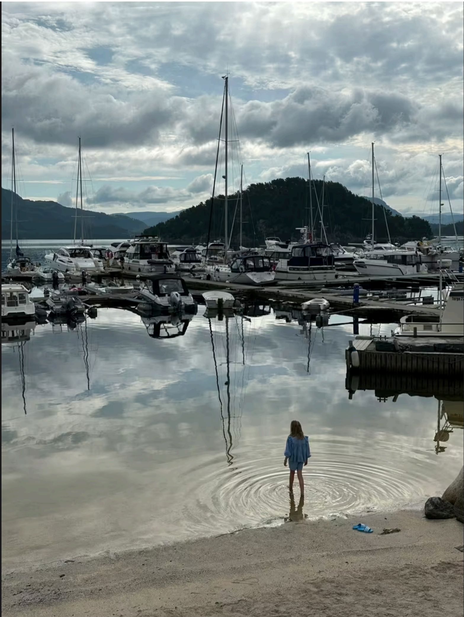
Mykje båt inne.

Ho fortel at ho aldri har opplevd eit slikt trøkk over så lang tid, men så opplever me også sjeldan å ha så godt og varmt vêr over så mange dagar på rad.