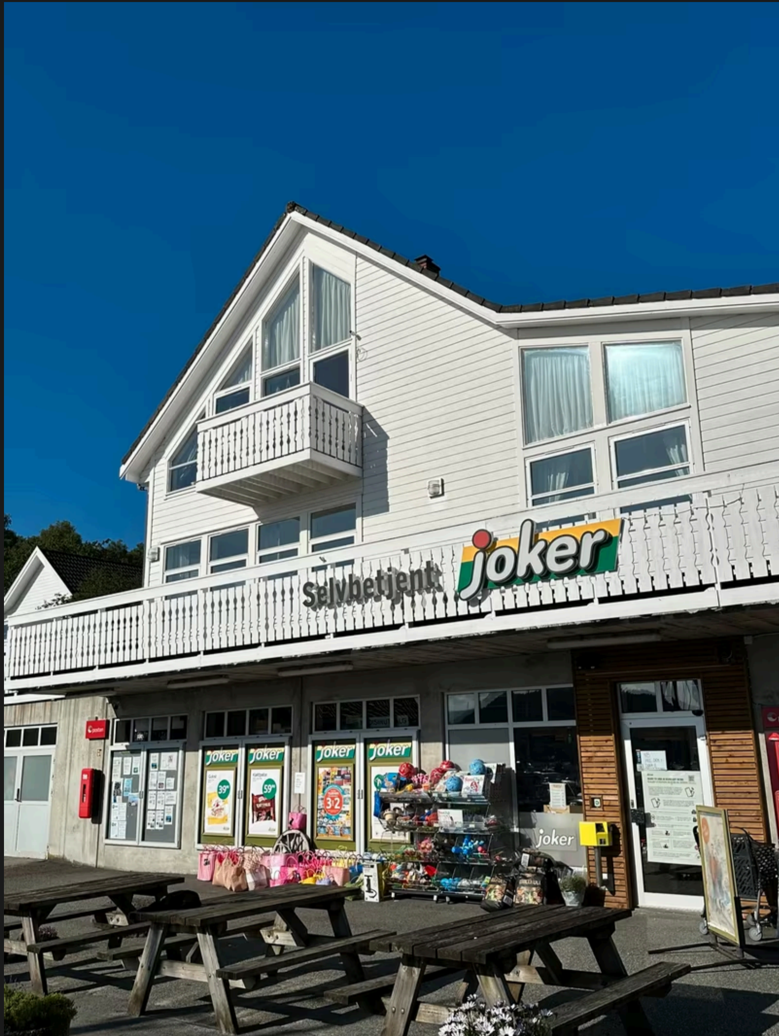
Stille før ein travel arbeidsdag på Joker og Skartveit gjestehavn.

dei siste vekene. At me kan bidra til at små og store får ein kjekk sommarferie, gjer jobben verdt det.